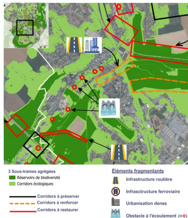
Figure 1 - Trame verte et bleue de Barentin et interprétation des éléments fragmentants

En s'appuyant sur les données disponibles et sur les services techniques des partenaires de l'étude, une image fine de l'occupation du sol a été élaborée. Elle a servi de socle pour aboutir à la détermination de trois sous-trames écologiques (milieux aquatiques et humides, milieux boisés et arborés, milieux ouverts), puis de corridors écologiques par traitement géomatique fondé sur les caractéristiques de déplacement d'espèces représentatives de chaque sous-trame. L'interprétation cartographique, complétée par des visites terrain pour confirmer ou infirmer les résultats, a fait ressortir en creux les secteurs du territoire les plus fragmentés. Une approche similaire mais adaptée au milieu urbain a également été mise en œuvre, pour aboutir à une trame urbaine.